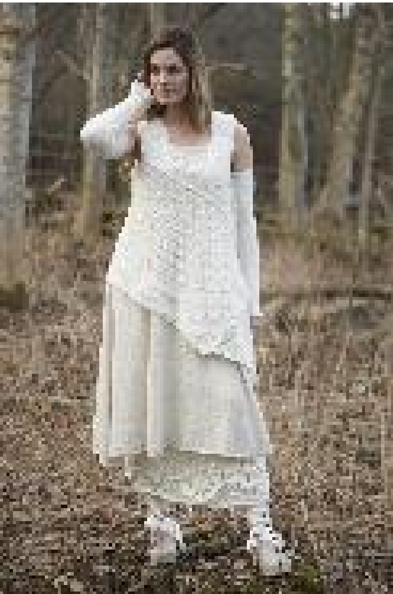
S7666 Fine Wool Rheuma Sjal/Väst/Vest Storlek/Størrelse: 1 size Garnåtgång/Garnforbrug: 7 n fg: 2070

S7663 Armmudd/Armvarmare, fg 2070 S7667 Lång tunika/Lang tunika , fg 2065 S7668 Klänning/Kjole, fg 2070