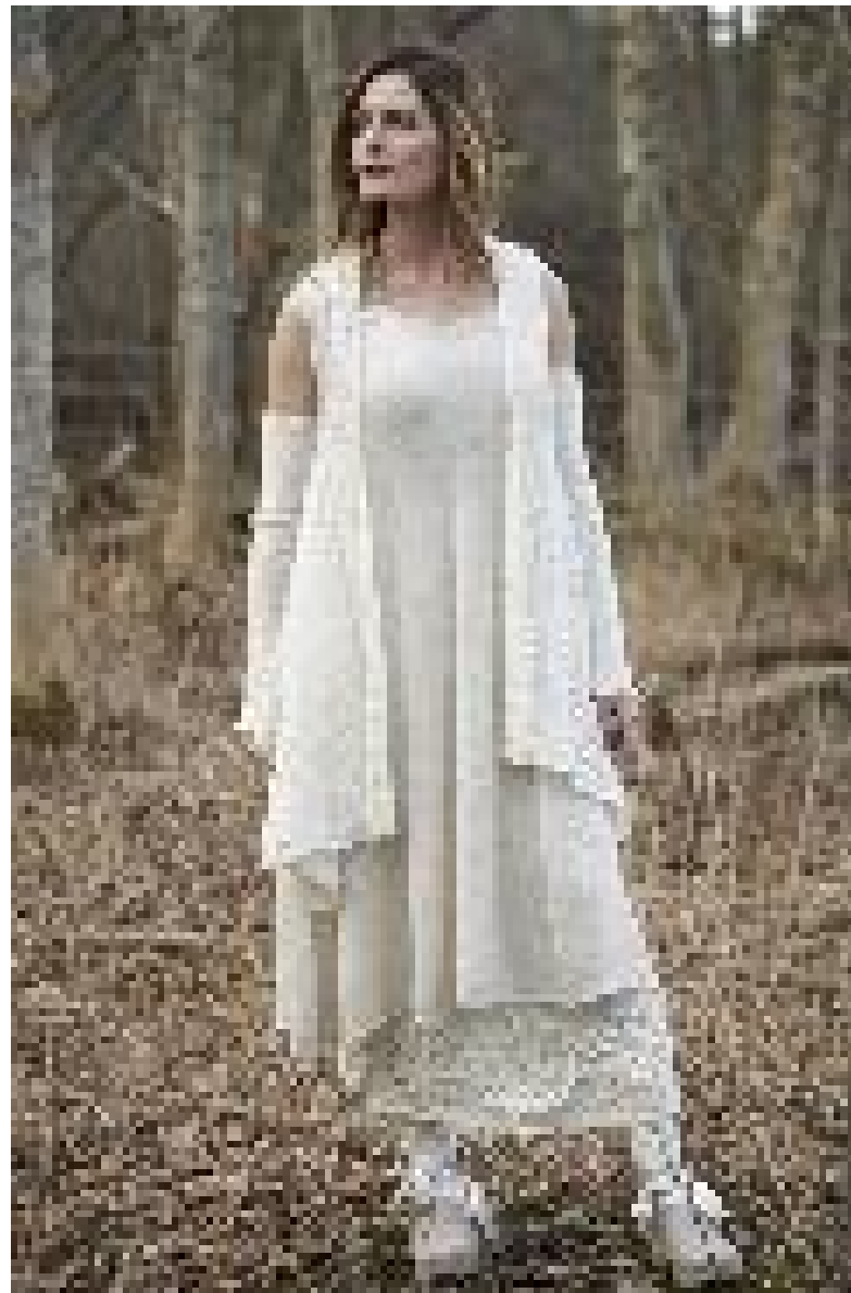
S7666 Sjal/Väst/Vest, fg 2070

S7663 Armmudd/Armvarmare, fg 2070 S7667 Lång tunika/Lang tunika , fg 2065 S7668 Klänning/Kjole, fg 2070